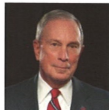
Grundad 2006 av Michael Bloomberg