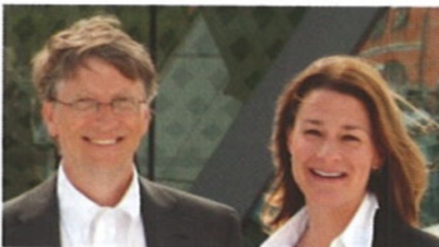
Grundad 2000 av Bill & Melinda Gates