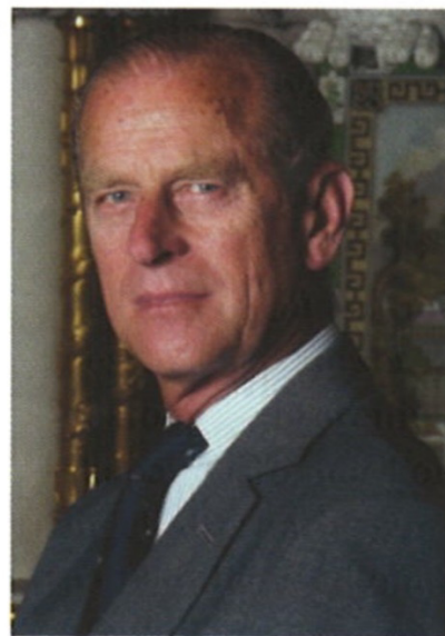
Prins Philip av England

Människans befolkningstillväxt är förmodligen det allvarligaste långsiktiga hotet mot överlevnad. Vi står inför en stor katastrof om den inte begränsas—inte bara för naturen utan även för den mänskliga civilisationen. Ju fler människor det finns, desto mer resurser kommer de förbruka, desto mer föroreningar kommer de att skapa, desto mer kommer de kriga. Vi har inget alternativ. Om den inte kontrolleras på frivillig väg kommer den att hämmas ofrivilligt genom en ökning av sjukdomar, svält och krig. 16