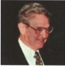
Grundad 1993 av George Soros